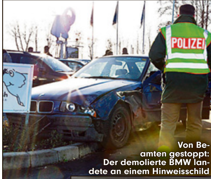
Von Beamten gestoppt: Der demolierte BMW landete an einem Hinweisschild

Saarlouis – Wollten sie mit diesem Irrsinn irgendein PC-Rennspiel nachstellen? Zwei Kinder lieferten sich am Samstagnachmittag eine Verfolgungsjagd mit der Polizei – quer durchs Saarland.